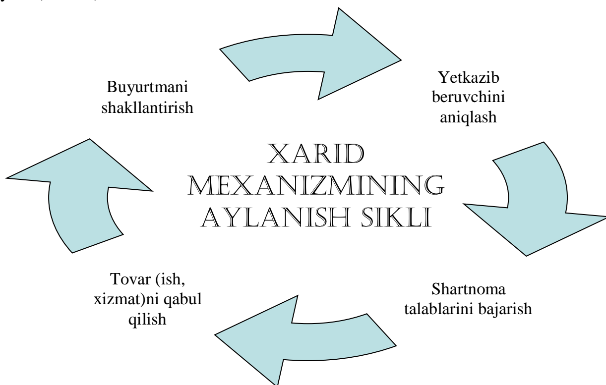
1-rasm. Davlat xaridlari mexanizmining aylanish sikli.

Davlat xaridlarida davlat ustunlik qiladi, iqtisodiy jarayonlarni tartibga soluvchi subyekti sifatida ishtirok etadi. Davlat xaridlari mexanizmi ma'lum sikl bo'lib o'z amalga oshirish jarayoni, me'yorlari moliyalashtirish manbalari, xuquqiy asoslari, tartib tamoillari, taomillari, subektlari, amalga oshirish tartibi va uzviy bog'liqligiga ega, yani (1-rasm):