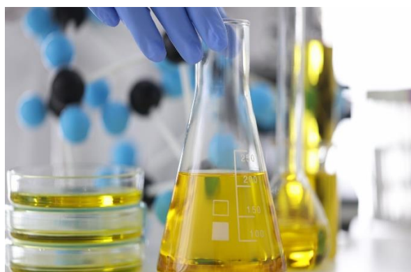
4-rasm. Kislota-ishqor bilan tozalash

Kislotali-kontaktli tozalash kislotali-ishqorli tozalashdan keyin amalga oshiriladi. Bunda tozalanadigan moylar tozalovchi tuproqlar yoki sun'iy silikagel bilan 20-100^{\circ}\text{C} haroratda aralashtiriladi. Qo'shiladigan tuproqlar miqdori 2-5% ni tashkil etadi.