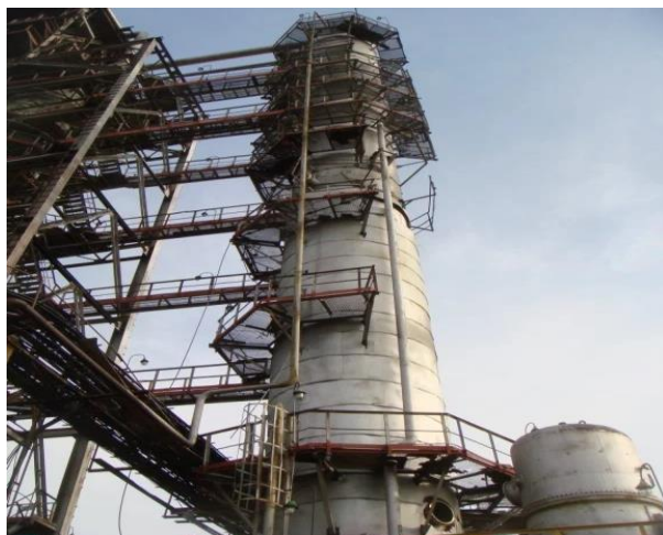
2-rasm. Rektifikatsion kolonna

Neftdan rektifikatsion kolonnada (2-rasm) birlamchi haydash usuli bilan olinadigan ekspluatatsion materiallar - yonilg‘i va moylarni to‘g‘ridan-to‘g‘ri ishlatish mumkin emas, chunki ularning tarkibida uglevodorodlardan tashqari, smolali – asfalt moddalari, oltingugurtli birikmalar, organik kislotalar va boshqa kerakmas moddalar bo‘ladi. Shuning uchun olingan neft maxsulotlarini kimyoviy jarayonlar - reaksiyalar orqali tozalashga to‘g‘ri keladi.