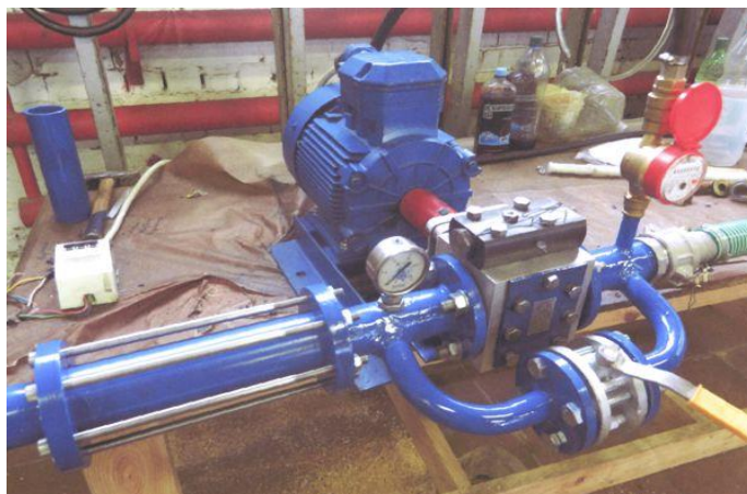
3-rasm. Gidrotozalash qurilmasi

katalizator ishtirokida olib boriladi. Bu usulda asosan dizel yonilg'ilari tozalanadi (3-rasm). Keng tarqalgan katalizatorlar –alyumo-kobalt va alyumonikel molibdenli katalizatorlardir. Oltinugurtni tozalashdan tashqari bu usul bilan to'yinmagan va aromatik uglevodorodlar vodorol bilan to'yintiriladi. Neftni qayta ishlash jarayonida to'yinmagan uglevodorodlar hosil bo'ladi. Bular bitta yoki ikkita qo'shbog'li birikmalardir. Qo'shbog'lar juda bo'sh bo'lib, tez uzilishi natijasida biriktirib olish reaksiyasi ketadi. Ular oson oksidlanib smolalar, organik kislotalar va boshqa birikmalar hosil qiladi. Natijada neft mahsulotlari sifati yomonlashadi va dvigatellarni ishlashiga salbiy ta'sir ko'rsatadi. Shu sababali, benzin tarkibidagi to'yinmagan uglevodorodlar vodorod bilan to'yintiriladi.