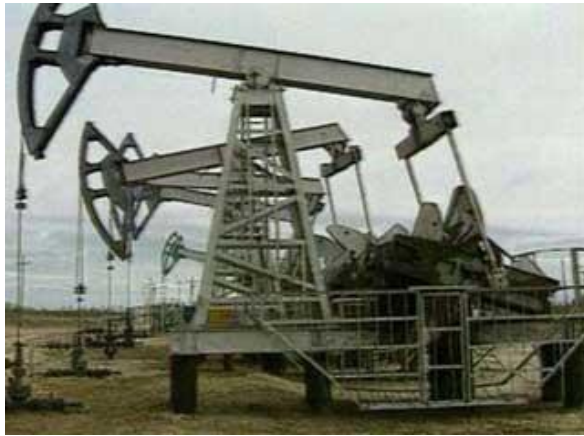
1-rasm. Neftni quruqlikda qazib olish qurilmasi

moylari xossalaridan tashqari ularni transportirovka, saqlash va foydalanish jarayonidagi ajralmas tarkibiy qismlaridan biri hisoblanishi va bu jarayonlarda o‘z xossalarini saqlanishiga oid ham xarbiy xizmatchilardan kerakli darajadagi bilimlar bo‘lishligi talab etiladi.