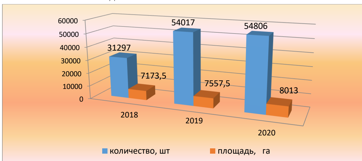
Источник: данные Министерства сельского хозяйства Республики Узбекистан Рис. 3. Динамика количества теплиц и земельной площади под ними

На рисунке 3 представлены данные по развитию теплиц в Республике Узбекистан за 2018-2020 годы.